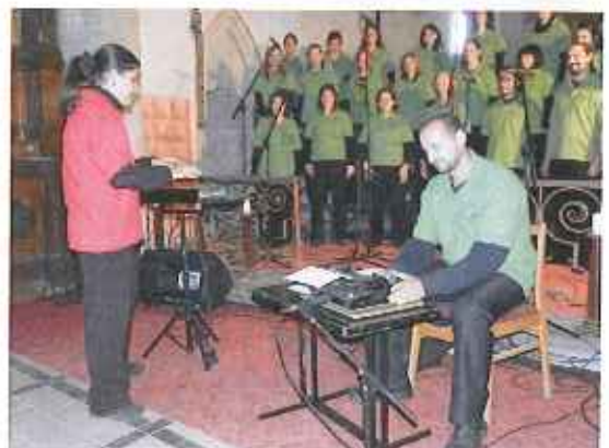
Václavský koncert sbor CANTICORUM