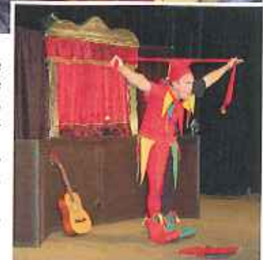
Představení pro děti Kašpárek a drak