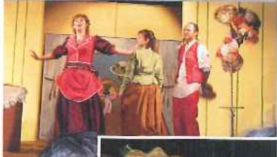
Oslavy zahájili mýtské ochotníky úspěšnou hrou Slaměný klobouk