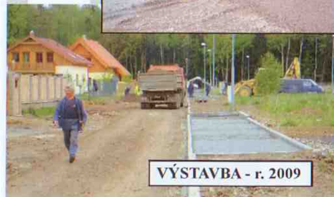
VÝSTAVBA - r. 2009