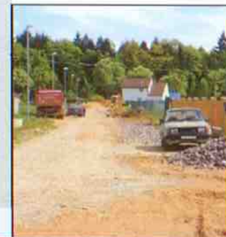
PŮVODNÍ STAV - r. 2005 - 2008

S přibývajícím dokončenými rodinnými domy vyvstala otázka dobudování místní komunikace. Po diskusích o její budoucí podobě byla nakonec zvolena varianta tzv. obytné zóny.