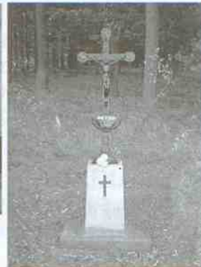
Obnovený pomník na místě vraždy ve "Studené kuchyni" za křížovatkou z Kařízku na Kařez