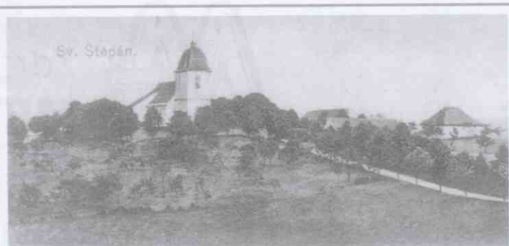
Hřbitovní kostel na archivní pohlednici

Z tohoto místa je potřebné poděkovat všem, kteří se zasloužili o to, že zvon Jarošův tyto doby tak pro zvony nepříznivé přestál a zachoval se do našich dob.