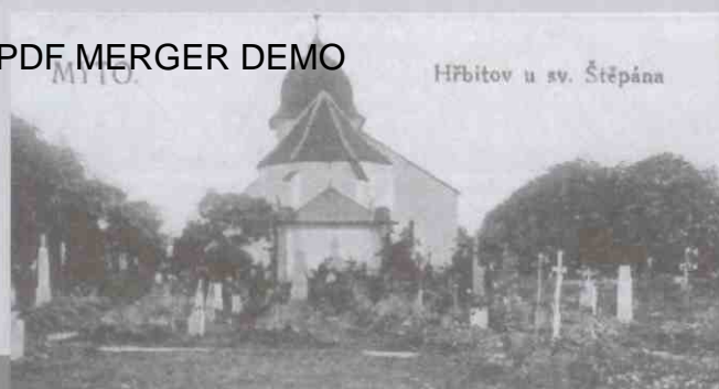
Hřbitov u sv. Štěpána

Kostel sv. Štěpána (s.3) nejstarší architektonická památka v Mýtě